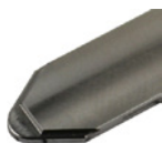
Herramienta de ranurado C001 sin soporte